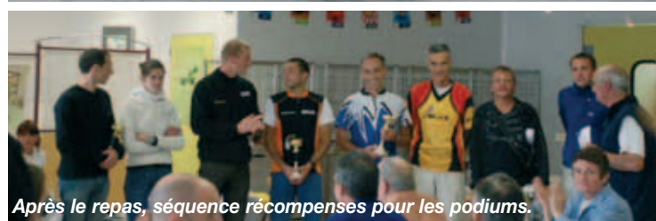
Après le repas, séquence récompenses pour les podiums.

P ar un temps radieux, dans l'air frais de la montagne sur la place du village de Seyne-les-Alpes (Alpes-de-Haute-Provence), les équipes embarquent aussitôt le contrôle des sacs terminé dans le car qui les transporte vers la zone de départ, au pied de la station de Saint-Jean-Montclar (alt. 1330 m).