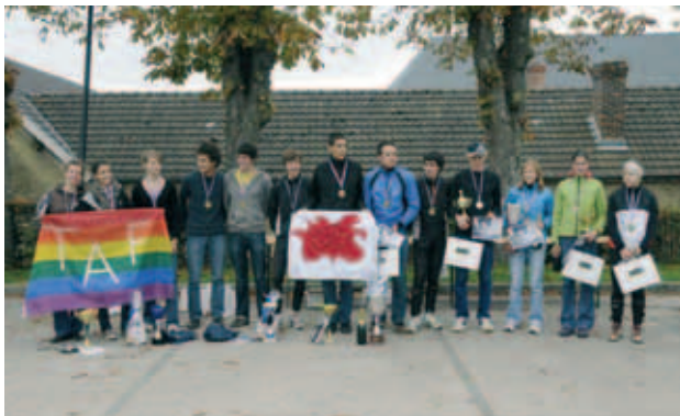
Podiums Seniors et Juniors du CF de Sprint