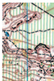
Extrait de carte : Au nord, l'extrémité du plateau avec des traces d'anciennes carrières. Au sud, le flanc du rû de Cernay avec rochers, rentrants et charbonnières.