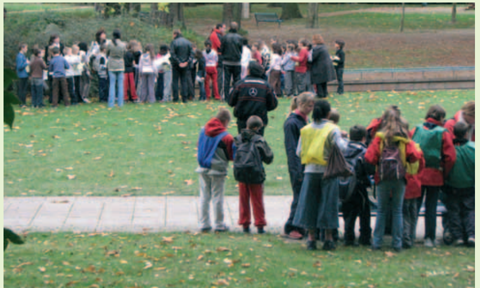
Séance d'initiation au parc de la Patte d'Oie à Reims.