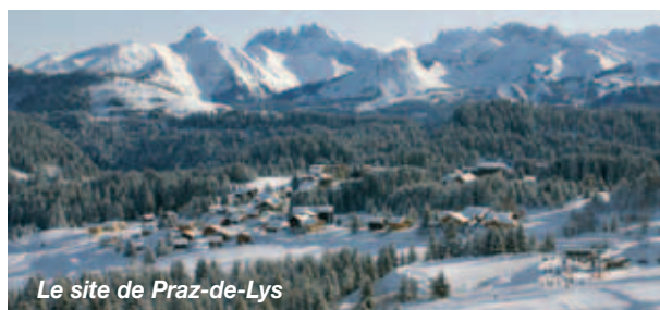
Le site de Praz-de-Lys