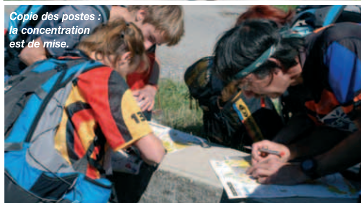
Copie des postes : la concentration est de mise.