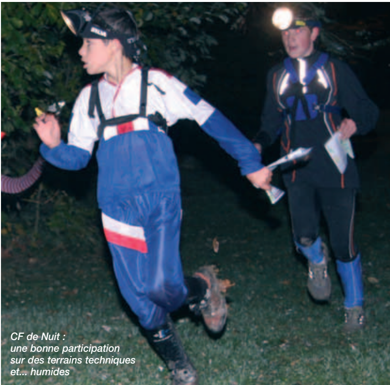
CF de Nuit : une bonne participation sur des terrains techniques et... humides