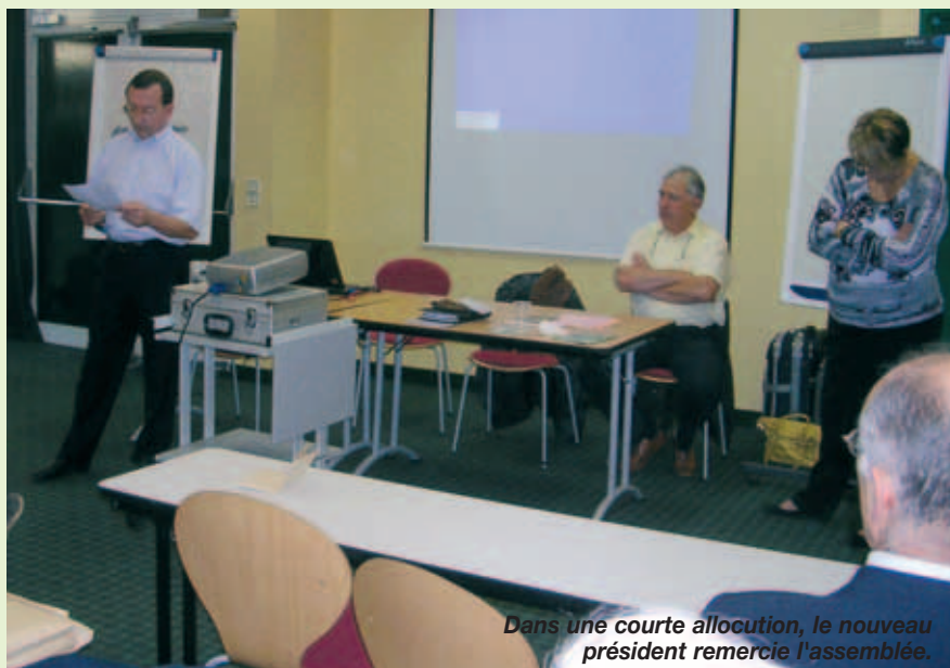
Dans une courte allocution, le nouveau président remercie l'assemblée.

Tout d'abord je dois remercier cette équipe qui a énormément travaillé depuis le mois de mars dernier et dont la motivation est sans faille. Les priorités sont nombreuses et se bousculent à la porte. Je citerai les principales, à savoir la consolidation de nos finances avec la recherche de nouveaux