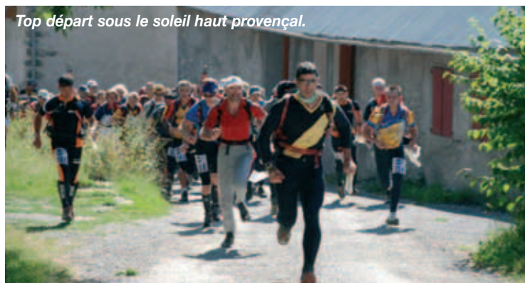
Top départ sous le soleil haut provençal.