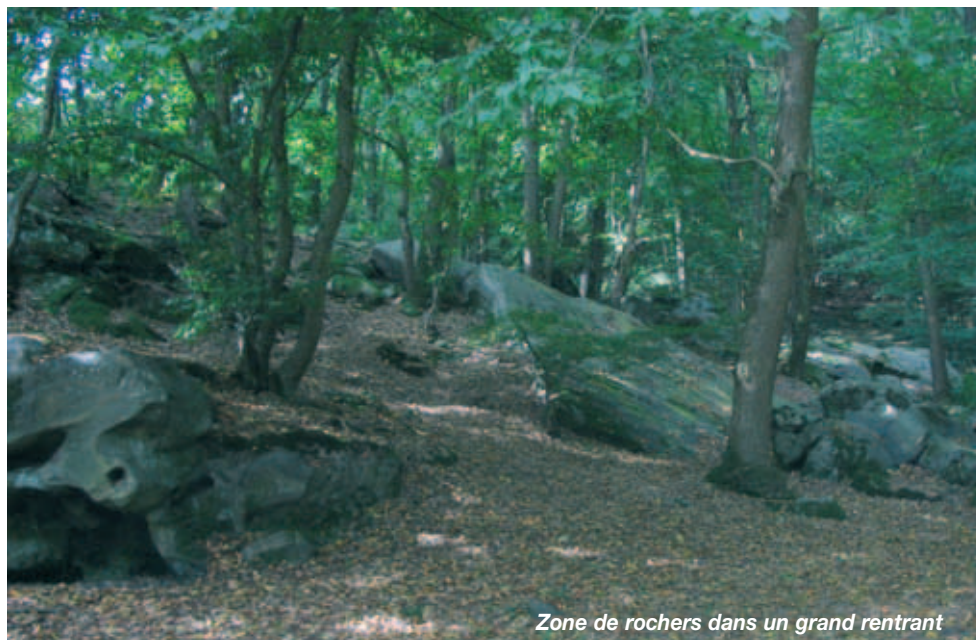
Zone de rochers dans un grand rentrant