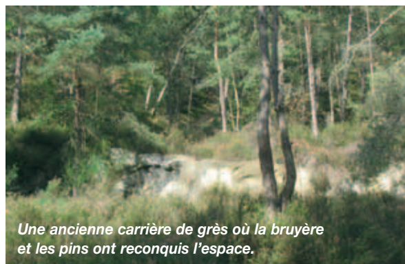
Une ancienne carrière de grès où la bruyère et les pins ont reconquis l'espace.