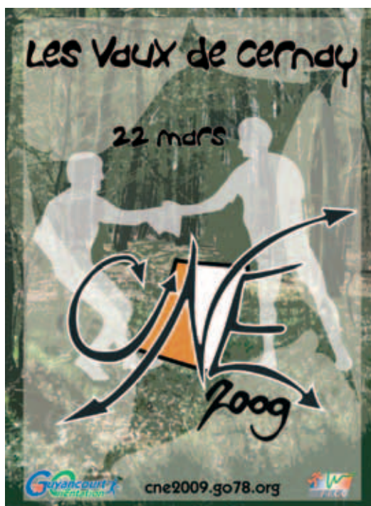
Affiche du CNE 2009 réalisée par Camille Clouard pour le GO 78

De la publicité a été faite dans plusieurs pays européens. La proximité géographique ainsi que des liens amicaux