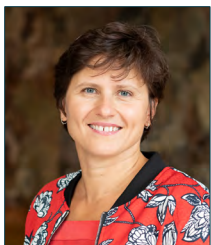
Roxana Maracineanu Ministre des Sports