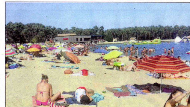
La base de loisirs de Clarens sera un des sites retenus centre de course situé au lac de Clarens.

La cérémonie des récompenses se déroulera le samedi 22 avril vers 18h30 au