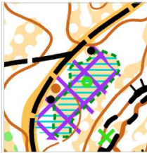
Utilisation du symbole 709.000 - Zone interdite d'accès

Échelle : 1/10000 et 1/7500 Équidistance : 5m