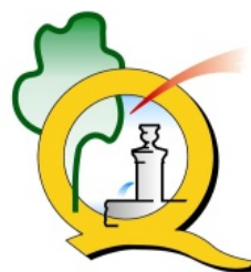
Commune de Quincey